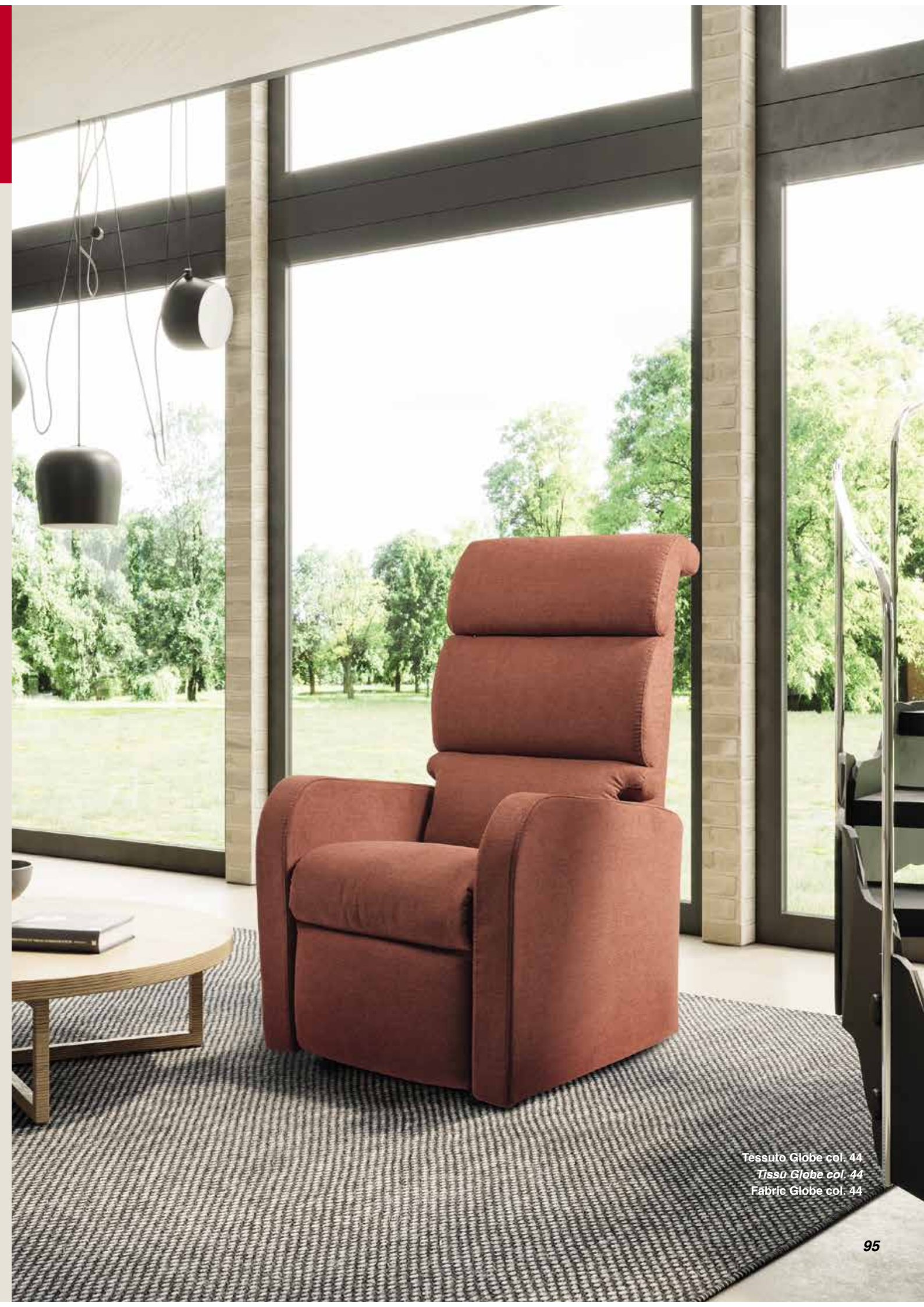
Tessuto Globe col. 44 Tissu Globe col. 44 Fabric Globe col. 44