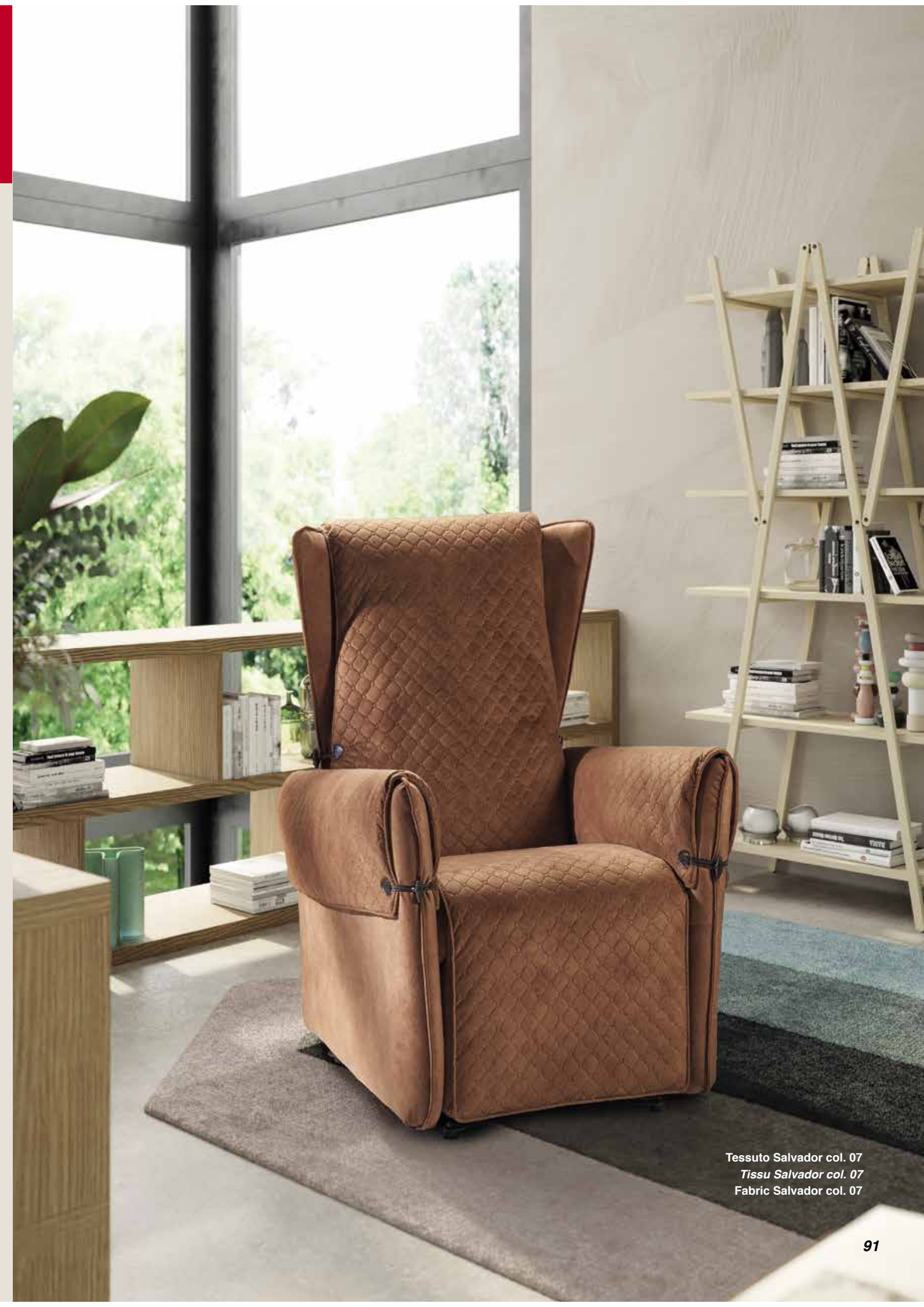
Tessuto Salvador col. 07 Tissu Salvador col. 07 Fabric Salvador col. 07