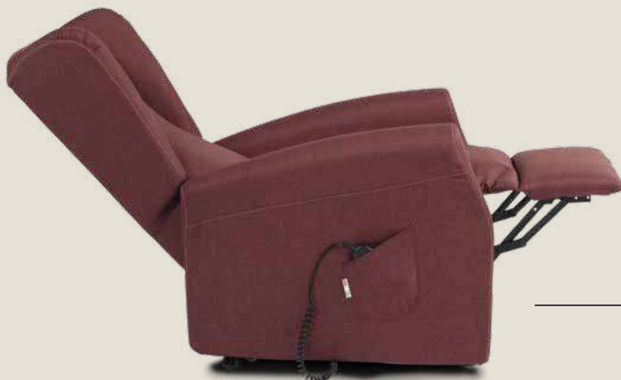
POLTRONA TRILLY CON TIPOLOGIA BRACCIOLO 2