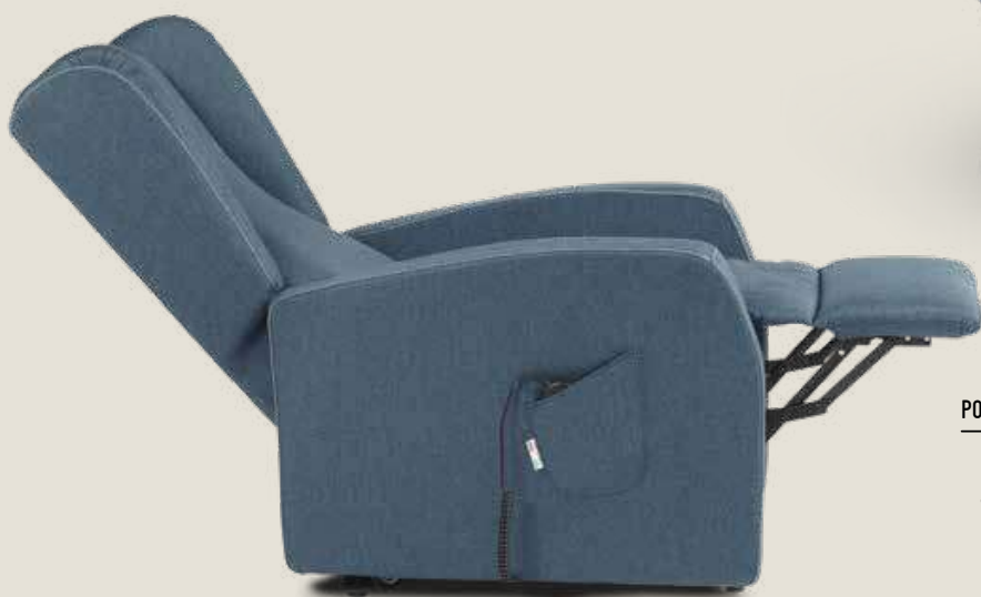
POLTRONA TRILLY CON TIPOLOGIA BRACCIOLO 1