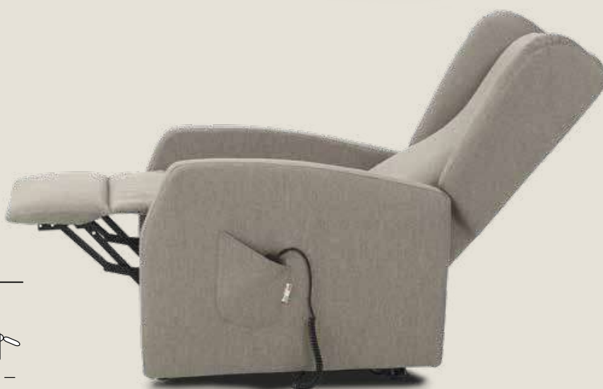
POLTRONA TRILLY CON TIPOLOGIA BRACCIOLO 3